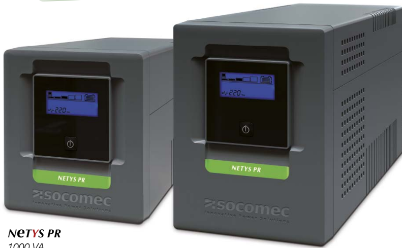
NETYS PR 1000 VA