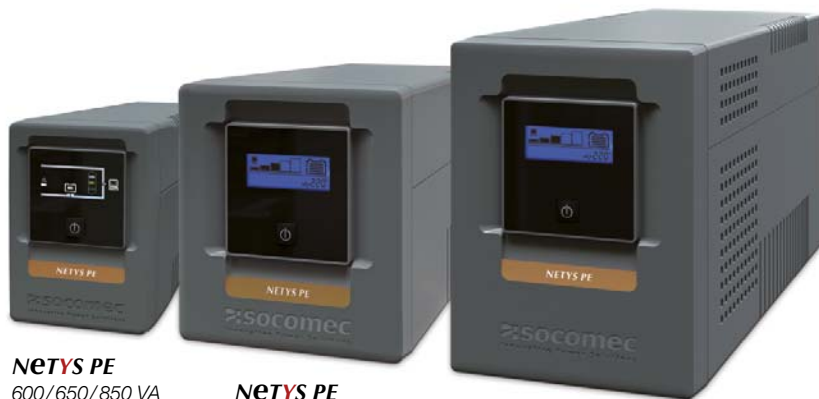
NETYS PE 600/650/850 VA